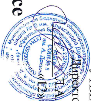
График консультаций в 9 классе